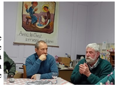
Accueil d'un témoin d'Alep en Syrie

Une première réponse coule de source, venant de son ancrage dans notre culture. Elle se rapporte aux moments forts de la dernière semaine de la vie du Christ. Le premier est l'accueil enthousiaste qu'il reçoit à Jérusalem, fruit de ses paroles et de son attention à tous. Viendra ensuite la dernière Cène , ce repas où par le partage du pain, Jésus rend présent le don de sa vie ; il l'exprime également en lavant les pieds de ses disciples. Ensuite vient sa mort dans laquelle il ne concèdera pas un pouce au mal et enfin sa résurrection, marque d'une vie reconnue par Dieu, traversant la mort.