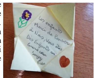
Réponse d'une personne détenue à la lettre d'un enfant d'une école