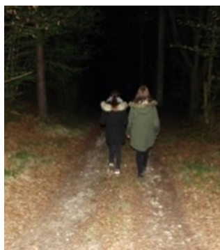
Deux jeunes s'aventurent dans la nuit

Quand nos vies s'enracinent dans la puissance de LA VIE.