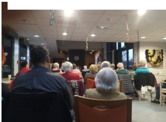
Beau moment de partage et de convivialité.