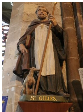
St Gilles, église de Malestroit