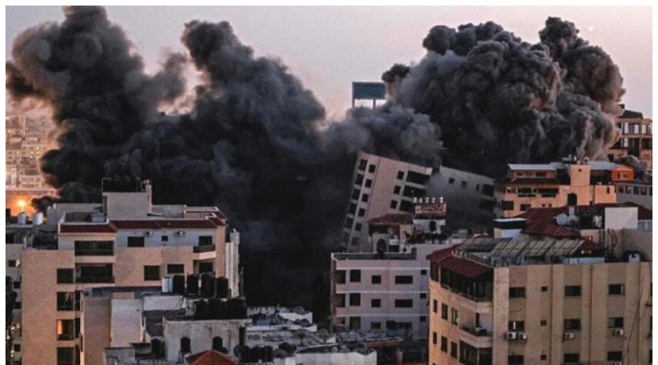
Bombardements à Gaza

Evangile : Jn 15, 26-27 ; 16 ; 12-15 « L'Esprit de vérité vous conduira dans la vérité toute entière »