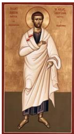
Saint Justin le Philosophe

Patron des philosophes, il est fêté le 1er juin .