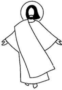
Transfiguration Vêtement blanc