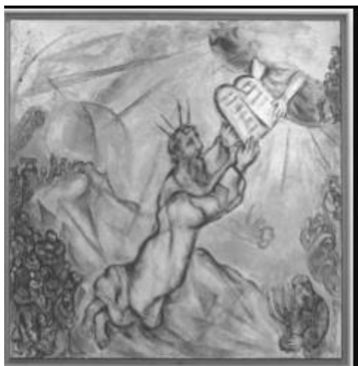
Marc Chagall : Moïse recevant les tables de la Loi