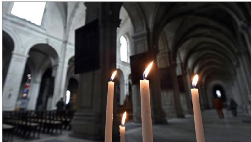
« Ni messes, ni baptêmes, ni mariages ne pourront être célébrés ».

Ce temps de prière sera animé par une seule personne faisant respecter les recommandations de prudence. La bénédiction du défunt se fera sans eau. La prière devra être