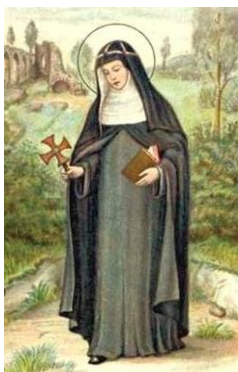
Ste Brigitte d'Irlande (avec la croix à la main)