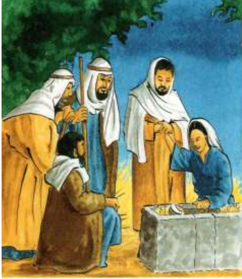
L'Ange du Seigneur apporte la bonne nouvelle.