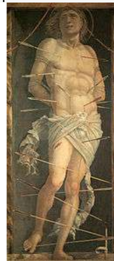
St Sébastien, tableau d' Andrea Mantegna (1490) Palais La Ca' d'Oro à Venise

Surtout invoqué pour lutter contre la peste et les épidémies en général, il inspira les sportifs par son histoire et par ses qualités en tant qu'archer, c'est ainsi qu'il fit l'objet d'une dévotion particulière à partir des années 1920, quand les sportifs commencèrent à concourir à titre professionnel. C'est pourquoi, il devint leur Saint patron ainsi que celui des arbalétriers, des archers, des athlètes, mais aussi des prisonniers. Saint Sébastien est fêté le 20 janvier .