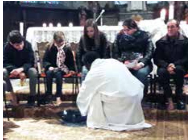
Lavement des pieds.