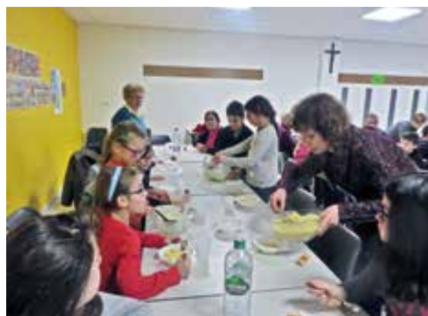
Temps fort carême.