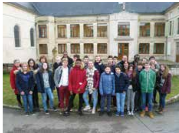
Retraite jeunes confirmants des 10 et 11 février.