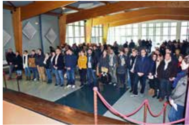
Journée des fiancés à BV.

- Peu d'églises étant équipées, la paroisse a acheté une sono portative. Prochaine réunion le 3 mai 2018 à 20h - Les Souhesmes