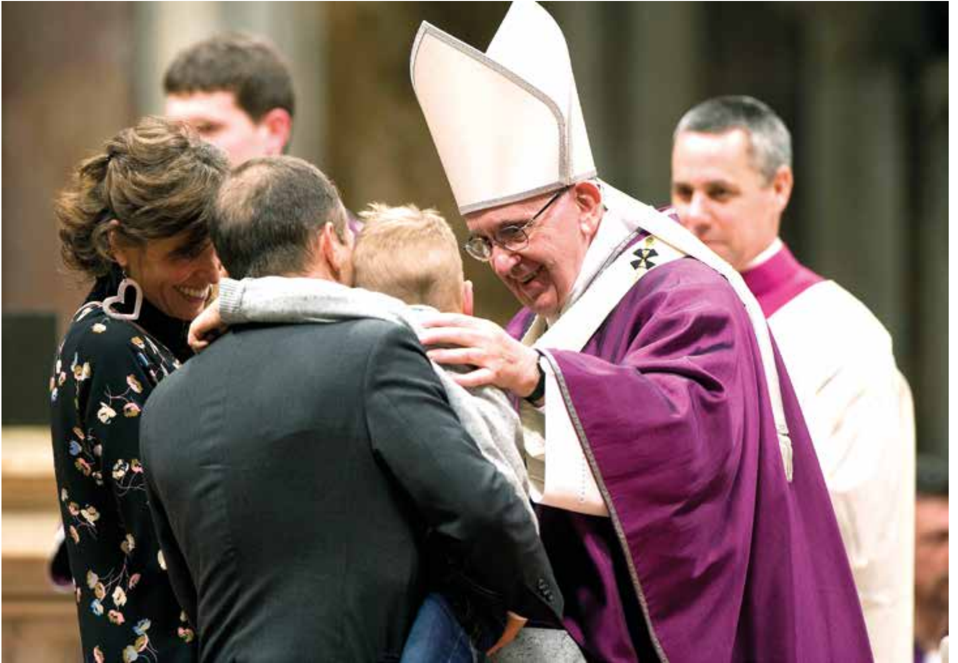
10 février 2016 : Le pape François félicitant une famille lors de la messe du mercredi des cendres célébrée en la basilique Saint Pierre au Vatican, Rome, Italie.

À la fois radioscopie des situations familiales actuelles, discours sur l'amour conjugal, manuel de pédagogie et retour d'expériences pastorales, l'exhortation du pape François «sur l'amour dans la famille», «Amoris laetitia», rendue publique vendredi 8 avril 2016, invite l'Église à aider les familles à avancer et à surmonter, au cas par cas, leurs difficultés, sans imposer de solution générale.