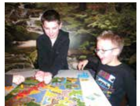
Une ouverture à de nouveaux jeux de société.