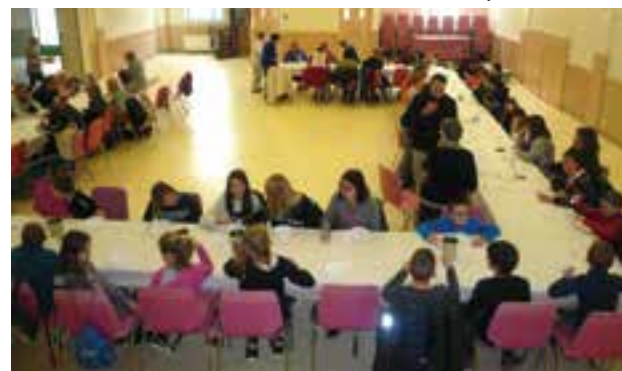
De nombreux participants de tous âges.