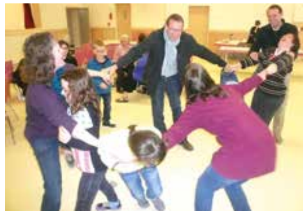
Un moment de jeu et de rires.