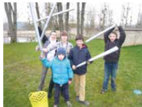
Le trollball, un vrai jeu de trolls apprécié de tous.