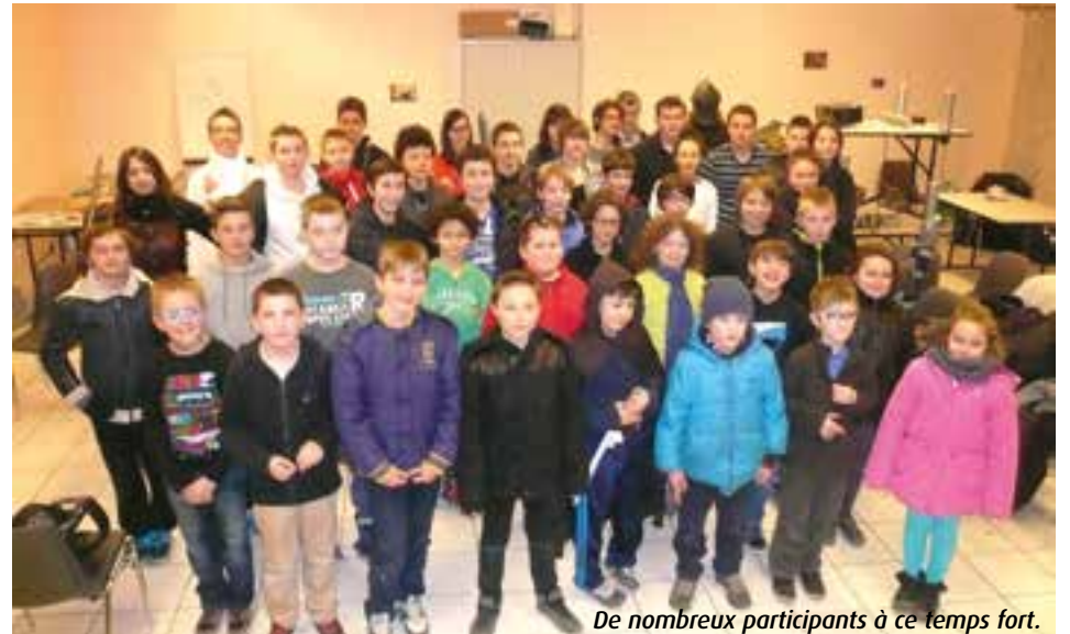
De nombreux participants à ce temps fort.