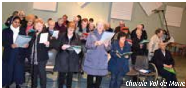
Chorale Val de Marie

rentes activités y sont proposées. Dès 5 ans, une initiation musicale permet aux plus jeunes de découvrir cet univers de la musique. À 6 ans, ils découvrent les différents instruments afin de choisir celui qu'ils auront envie de pratiquer. Enfin, de 7 à 77 ans (je n'ai pas l'âge du plus ancien !) chacun peut jouer du piano et s'imaginer Chopin ou bien gratter la guitare pour accompagner les Gypsy King. On peut aussi faire chanter une flûte traversière ou un saxophone si on a toutes ses dents ! Enfin avec beaucoup d'énergie, on peut faire trembler les murs avec la batterie. Cours pratique et formation musicale sont complémentaires. Et pour