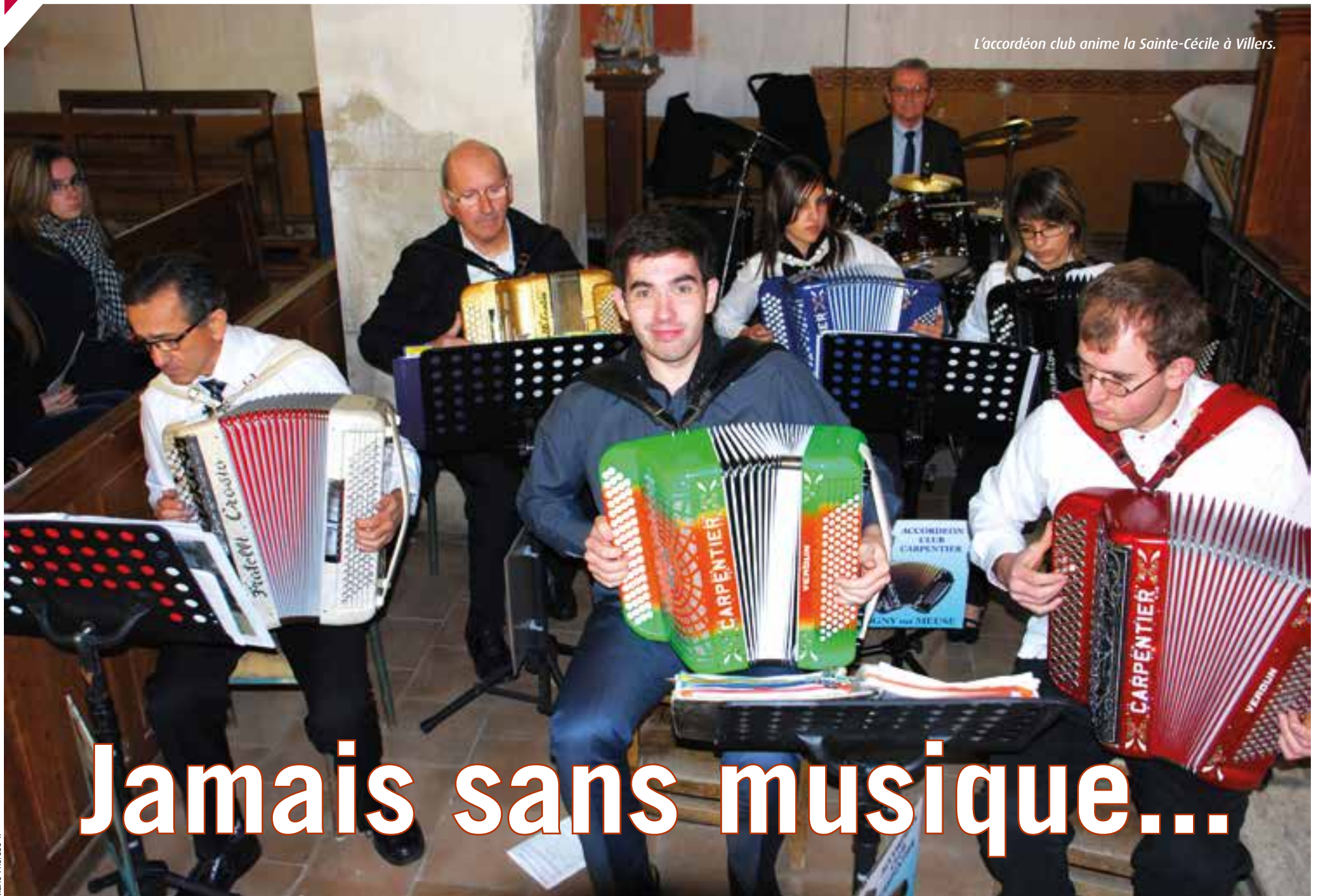
L'accordéon club anime la Sainte-Cécile à Villers.

JOURNAL CATHOLIQUE DE LA PAROISSE VAL DE MARIE - DIOCÈSE DE VERDUN