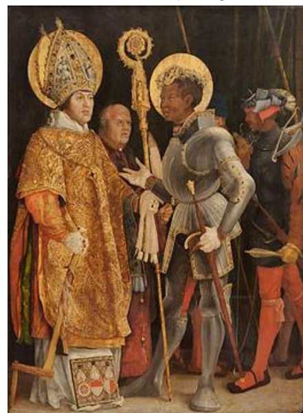
Saint Érasme et saint Maurice (à droite en armure) huile sur bois de Matthias Grünewald , c 1520-1524.

« Empereur, nous sommes tes soldats, mais aussi les serviteurs de Dieu. A toi, nous devons le service militaire, à Lui, une conscience pure. Nous sommes prêts à porter les mains contre n'importe quel ennemi, mais nous estimons que c'est un crime que de les ensanglanter en massacrant des innocents. Nous avons d'abord prêté serment envers Dieu, ensuite nous avons prêté serment envers le souverain. Sois persuadé que le second n'a plus aucune valeur pour nous si nous avons rompu avec le premier. »