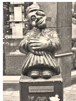
Statue de Sint-Juttemis, le saint Glinglin néerlandais, à Breda (Pays-Bas) en 2008.

Un jour qu'on venait de lui confier la direction d'un journal, Clémenceau s'aperçut rapidement que ses rédacteurs écourtaient singulièrement leurs heures de présence. Aussi, deux jours plus tard, le « Tigre » fit passer cette note : « Messieurs les rédacteurs sont instamment priés de ne pas partir avant d'être arrivés. », et quand, nommé pour la première fois ministre, alors qu'il visitait ses bureaux, il n'y trouva, à l'heure du plein travail, qu'un seul employé, encore, celui-ci dormait-il, il répondit à son escorte qui voulait le réveiller : « Non ! non ! ne le réveillez pas ! il s'en ira ! ».